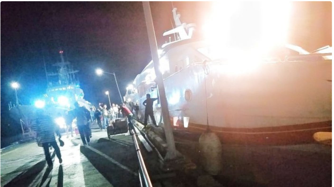
Pihak Penyidik Polda Sultra Dari Kendari Tiba Di pelabuhan Murhum Baubau. Rabu (23/08)

BAUBAU - Informasi beredar jika Pihak Polda tiba diBaubau malam ini, Rabu (23/08)