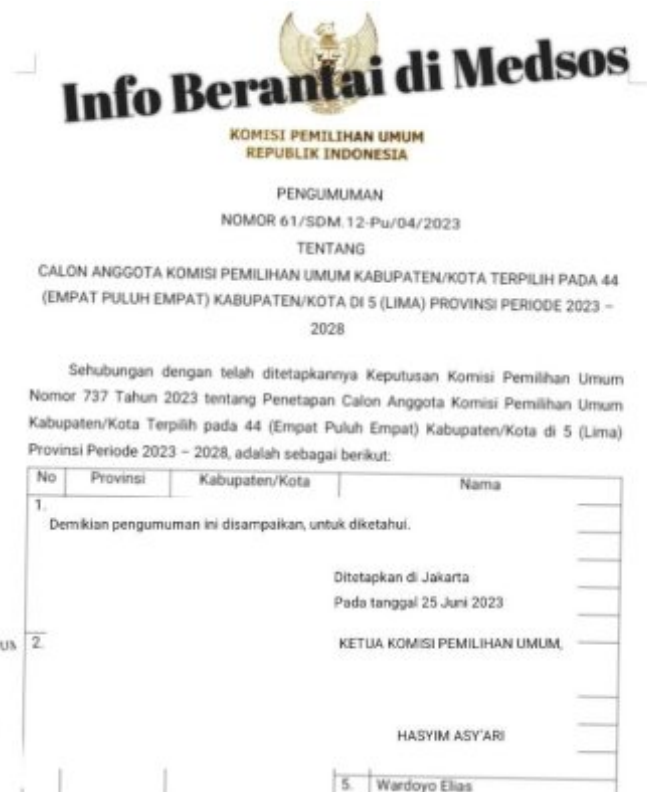
Gambar Pengumuman KPU RI Secara Resmi dan Yang Tersebar Luas di Media WhatsApp

BAUBAU - Beredar Pengumuman Calon Komisioner KPU pada 44 Kabupaten/Kota di 5 Propinsi yakni Sulawesi Utara, Sulawesi Selatan, Sulawesi Barat, Sulawesi Tenggara, dan Kepulauan Riau di Sinyalir menjadi berita bohong atau HOAX.